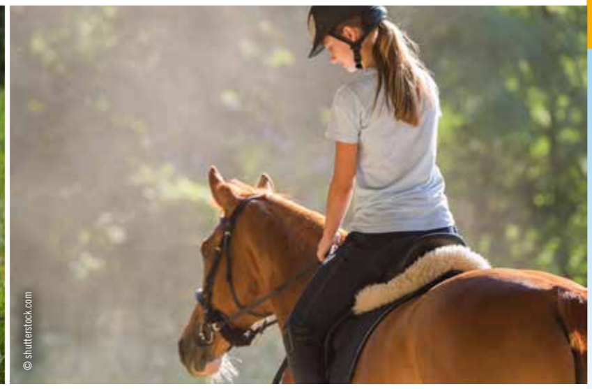
Faszination Pferd: lässt jedes Kinderherz höher schlagen.

Tourismusverband Tiroler Oberland A-6531 Ried i.O. · Kirchplatz 48 Tel. +43(0)50/225100 · Fax +43(0)50/225110 office@tiroler-oberland.com www.tiroler-oberland.com