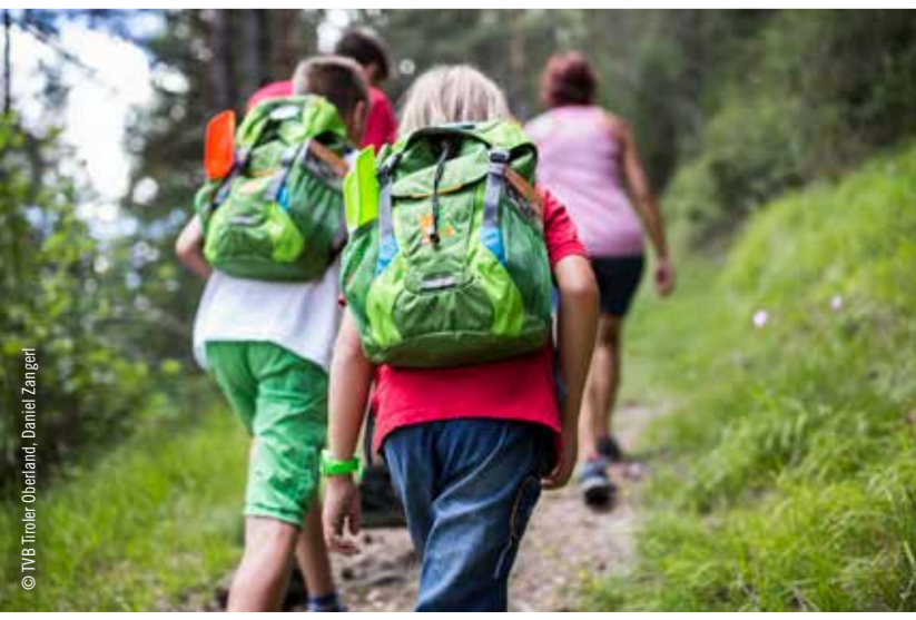
Abenteurrucksack - erhältlich in den Infobüros